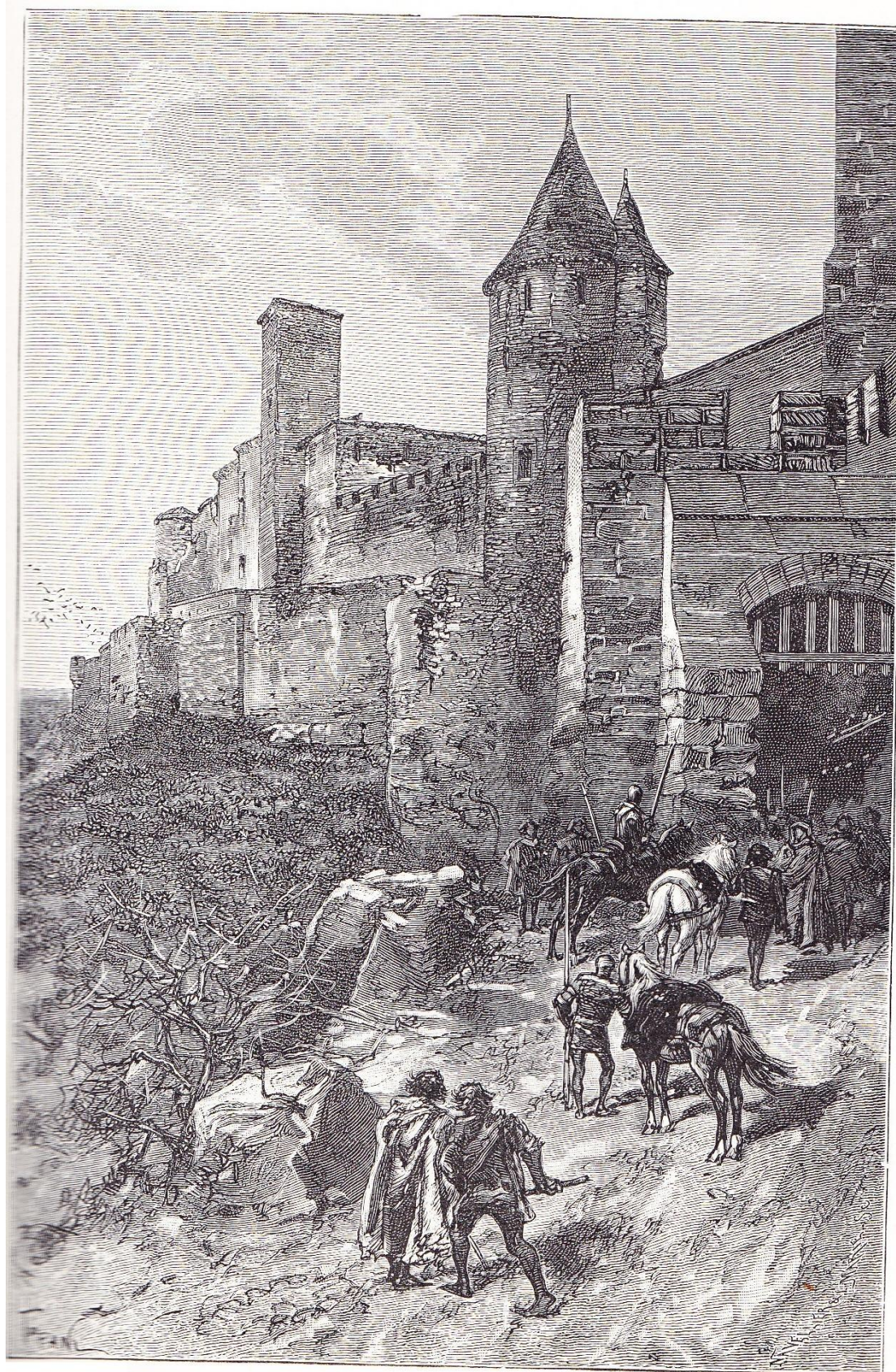
il TROUVA AU FAUBOURG QUELQUES-UNS DES COMPAGNONS DU BATARD DE COMMINGES (CHAP. XXXIII)